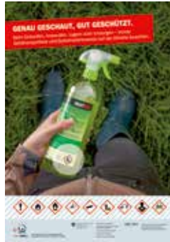
Sujet Garten Zielgruppe: Öffentlichkeit Bestellnummer BBL: 311.793.d