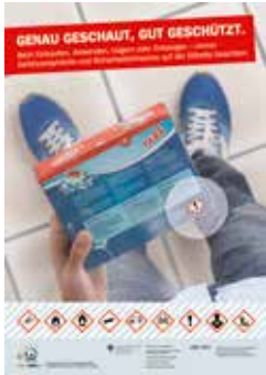
Sujet Haushalt Zielgruppe: Öffentlichkeit Bestellnummer BBL: 311.790.d

Es liegen vier verschiedene Plakatsujets vor. Dies ermöglicht Ihnen, die für Ihre Zwecke geeignetste Situation auszuwählen. Für mehr Aufmerksamkeit können Sie die einzelnen Sujets auch abwechseln.