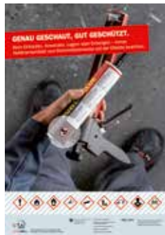
Sujet berufliche Anwender Zielgruppe: Berufspersonen Bestellnummer BBL: 311.791.d