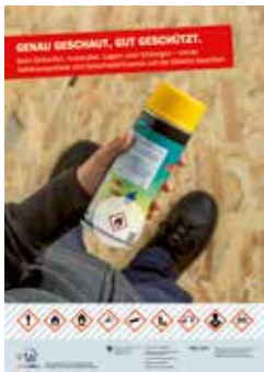
Sujet Heimwerken Zielgruppe: Öffentlichkeit und Berufspersonen Bestellnummer BBL: 311.792.d